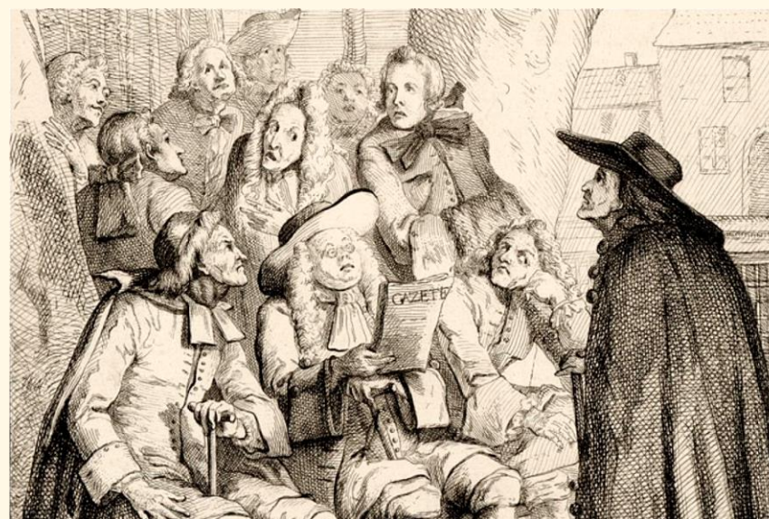
« Des nouvellistes dans un jardin écoutent la lecture d'une gazette », gravure, XVIII e siècle